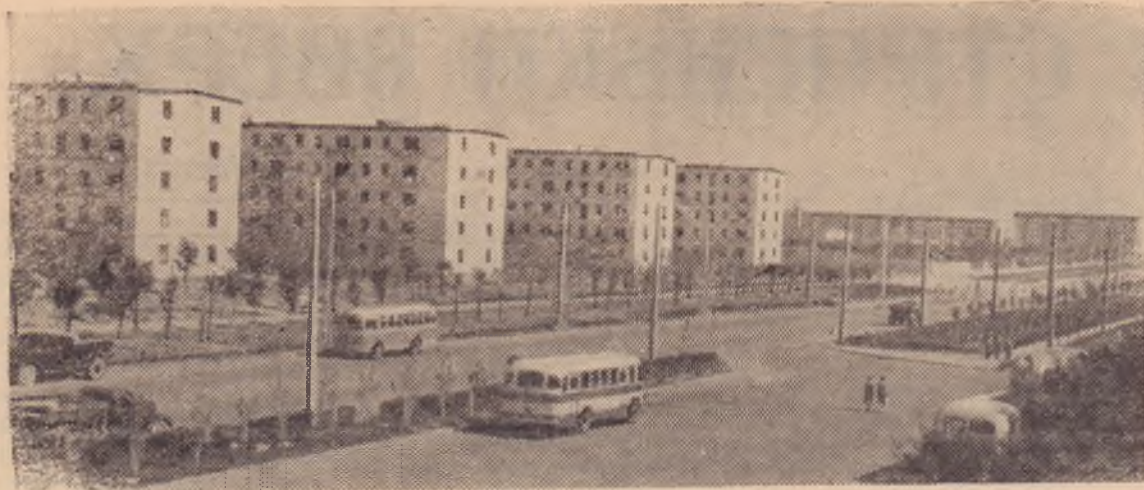
Волжский. Проспект имени В. И. Ленина.