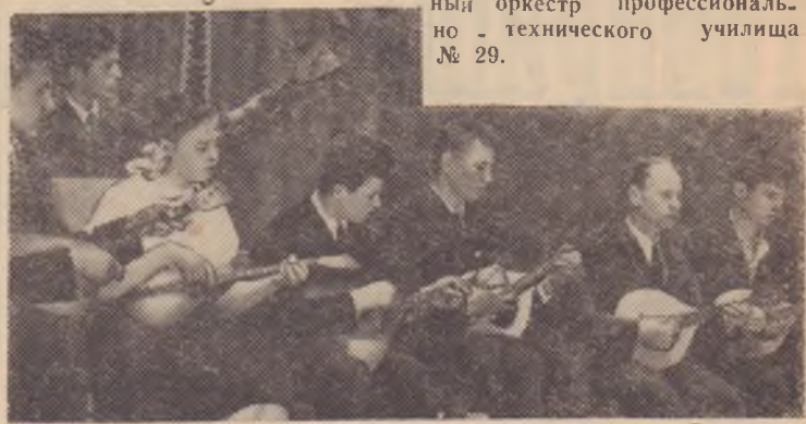
Самодельный струнный оркестр профессионально-технического училища № 29.