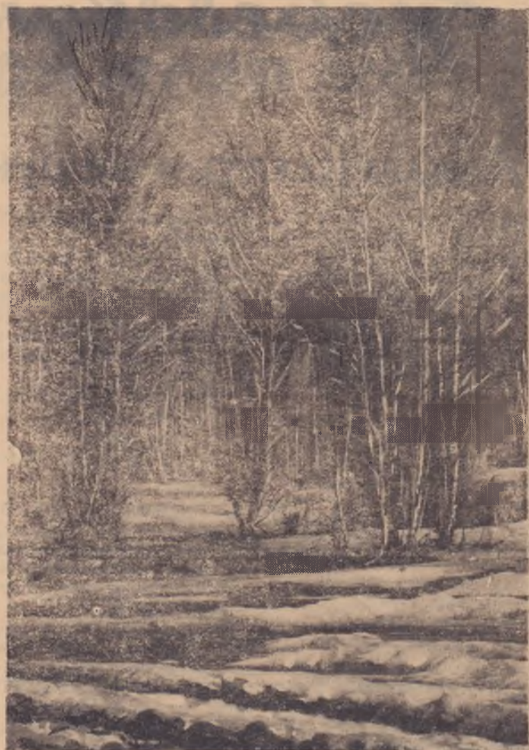
Апрель в лесу.

(Документы и дела архива Синода, т. 16, стр. 17—26).