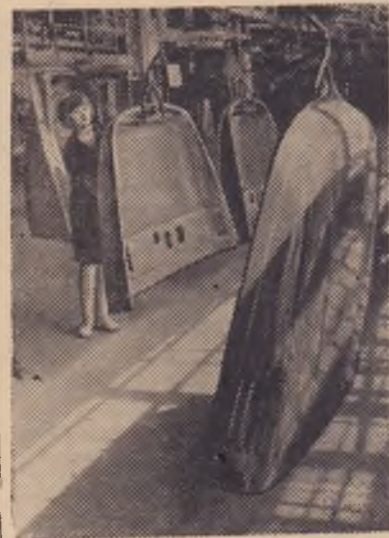
Один из участков комплексной механизированной покраски оперений автомобиля, вступивший в строй в этом году.

Через равное количество минут сходят с главного конвейера новенькие грузовики с маркой ЗИЛ. Их ждут на многих наших стройках и не только у нас в стране, но и далеко за ее пределами. Ведь на дорогах 42 стран мира можно встретить сейчас грузовики столичного предприятия.