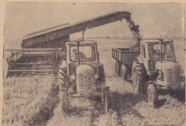
Замечательный урожай люпина вырастили хозяйства Брянской области. В колхозе «Ленинский путь» Почепского района с каждого из 250 гектаров скашивают по 250 центнеров зеленой массы. Колхоз заложит в этом году до 10 тонн люпинового силоса на каждую корову.