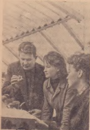
Ярославль. Сотрудники и студенты биолого-географического факультета педагогического института имени К. Д. Ушинского работают над проблемой использования сапропеля (озерного ила) в качестве удобрения. Трехлетние опыты на полях хозяйств Ростовского района показали, что на одном гектаре при внесении 60 тонн сапропеля можно дополнительно получить более 50 центнеров продукции (картофеля, овощей).

Зима—не время для отдыха. Кто думает по-другому, тот допускает непоправимую ошибку. Что упустишь зимой, то не наверстаешь весной. Ведь весна—время проведения полевых работ, а не время подготовки к ним. Готовиться к севу нужно сейчас. Поэтому руководителям колхозов, совхоза и партийным организациям нужно мобилизовать полеводов и механизаторов на всестороннюю подготовку к весне. Пусть каждый зимний день работает на урожай!