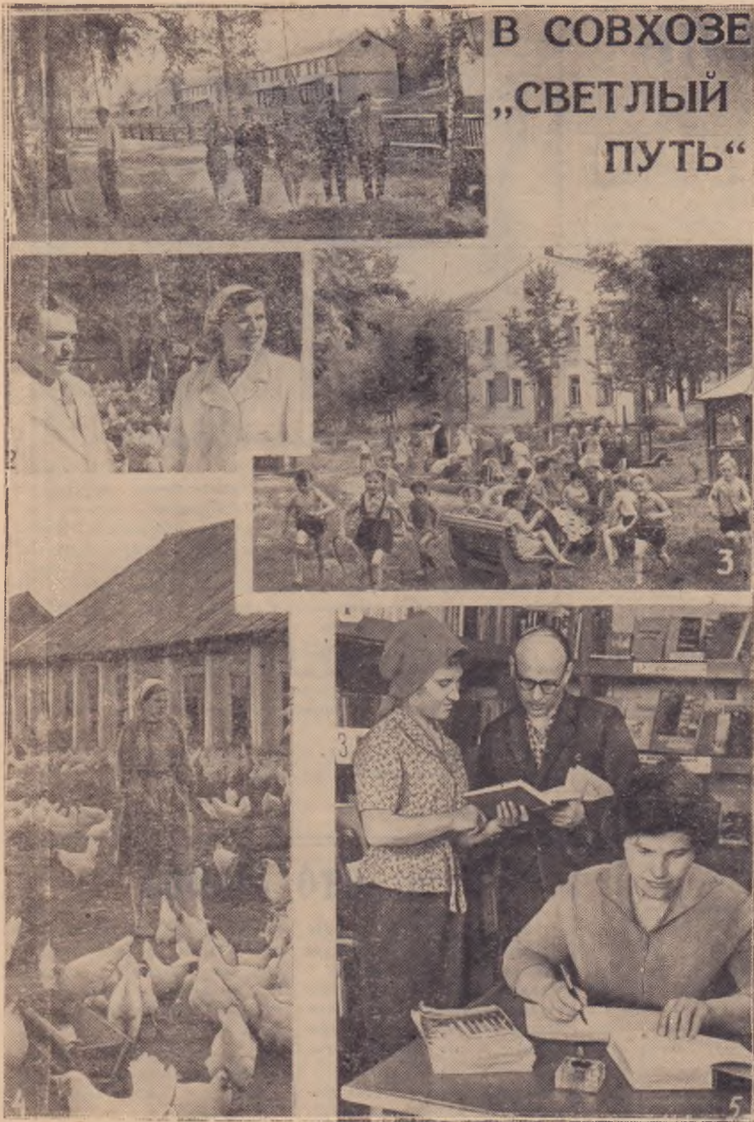
В СОВХОЗЕ „СВЕТЛЫЙ ПУТЬ“

АЛТАЙСКИЙ КРАЙ. Совхоз «Светлый путь» Первомайского района готовится к переходу на полный хозяйственный расчет. В последние годы хозяйство специализировалось на птицеводстве и стало рентабельным.