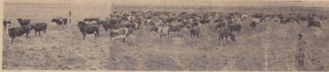
В совхозе имени Тельмана Ленинградской области созданы долголетние культурные пастбища. С 1 гектара здесь получают по 3,5 тысячи кормовых единиц.

На снимке: на одном из пастбищ совхоза.