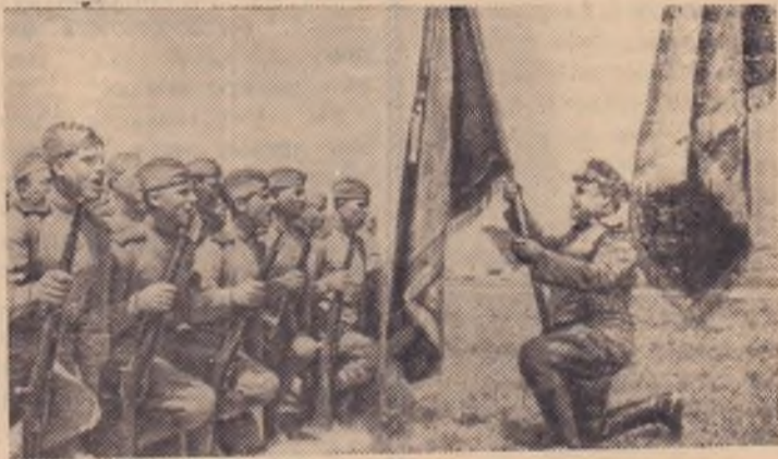
На снимке: воины у боевого знамени дают клятву бороться с врагом до полной победы.

На снимке: 1941 год. С парада на Красной площади воинские подразделения направляются на фронт.