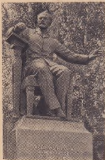
В Москве в настоящее время проходит Международный конкурс скрипачей, пианистов, виолончелистов и певцов имени П. И. Чайковского.

На снимке: памятник П. И. Чайковскому работы скульптора В. И. Мухиной.