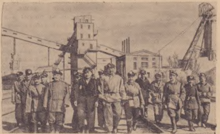
Шахтеры Монгольской Народной Республики увеличивают добычу угля.

На снимке: горняки шахты «Налайха-капитальная».