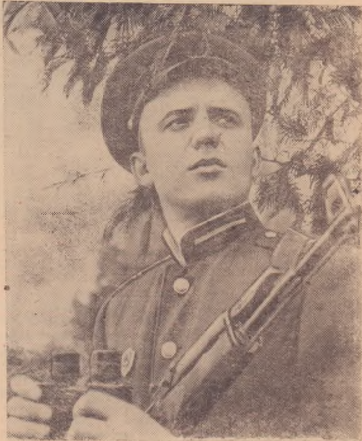
Бдительно несет службу на границе воин в зеленой фуражке!

Полеводы провели прополку лука на площади 1,7 гектара. Но на этом уход за по-