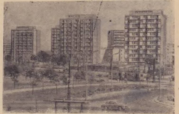
На снимке: новый жилой квартал Прага-2 в Варшаве. Столица, разрушенная войной до основания, не только достигла в своем развитии довоенного уровня, но значительно выросла, похорошела.