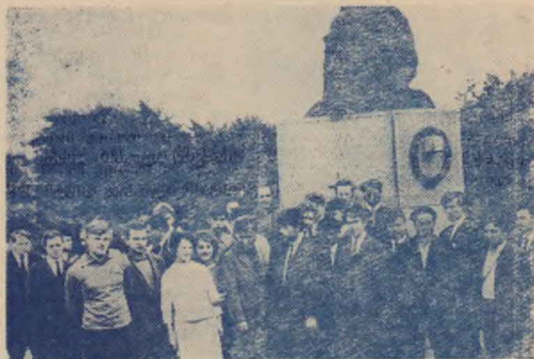
Англия. У могилы Карла Маркса.

А в Английском канале судно подверглось облету «американских пиратов». Примерно в течение двадцати минут амери-