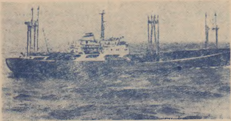
«Сухоналес» на пути в Арктику. Карское море.

шинство из них не знало друг друга. Знакомство же произошло на Черном море, где наши моряки принимали теплоход «Сухоналес» от судостроителей