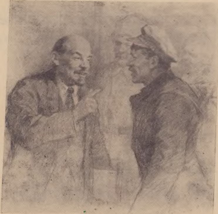
В. И. Ленин беседует с ходоками. Рис. художника П. Васильева.