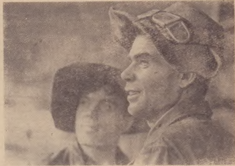
В Москве открыта фотовыставка «ТАСС-65». Это творческий отчет фотожурналистов Телеграфного агентства Советского Союза за минувший год. На выставке представлено 400 работ семидесяти авторов. В них повествуется о событиях

в стране и за рубежом. Творческий отчет фотожурналистов ТАСС посвящается XXIII съезду КПСС. Вот фотоснимок, представленный на выставке. Э. Брютаненко «Металлурги». Фотохроника ТАСС.