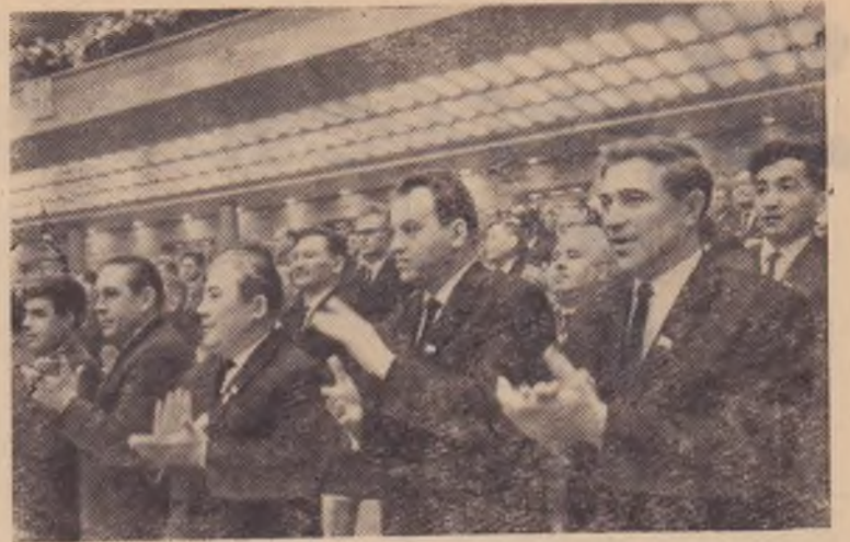
Москва. XXIII съезд Коммунистической партии Советского Союза.

Партийные организации призваны широко использовать в своей работе высокий политический и трудовой подъем народа. Надо добиться, чтобы каждый труженик в дни работы XXIII съезда КПСС стоял на ударной вахте и порадовал партию, Родину новыми трудовыми победами.