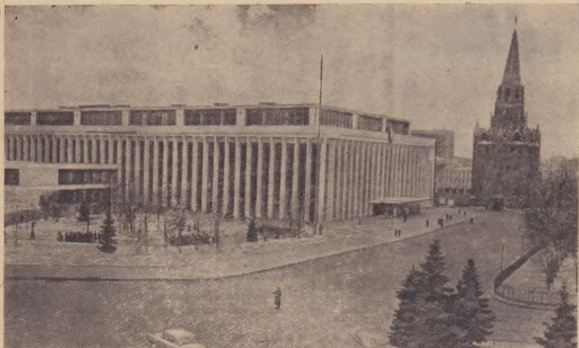
Москва. Кремлевский Дворец съездов. Здесь проходят заседания XXIII съезда КПСС.