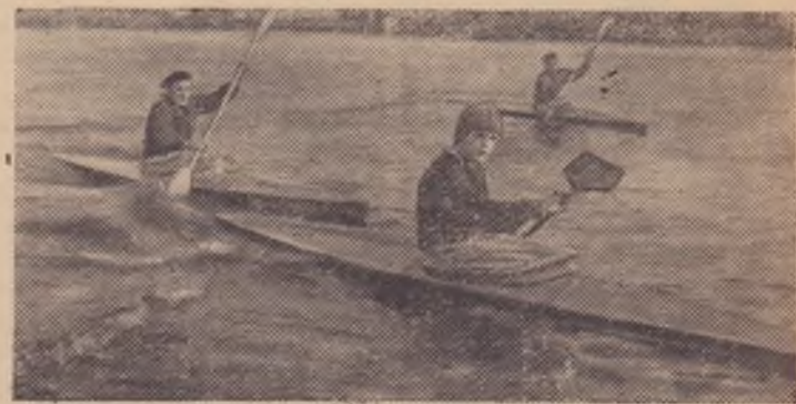
Николаев. Стоят теплые погожие дни. Байдарочники спортивной школы молодежи не прерывают своих тренировок на водных просторах Южного Буга и Ингула.

На снимке: байдарочники на тренировке.