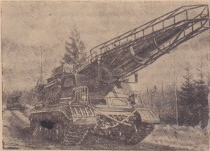
На снимке: ракетные установки на тактических занятиях.

Подполковник И. Новиков, военком района.