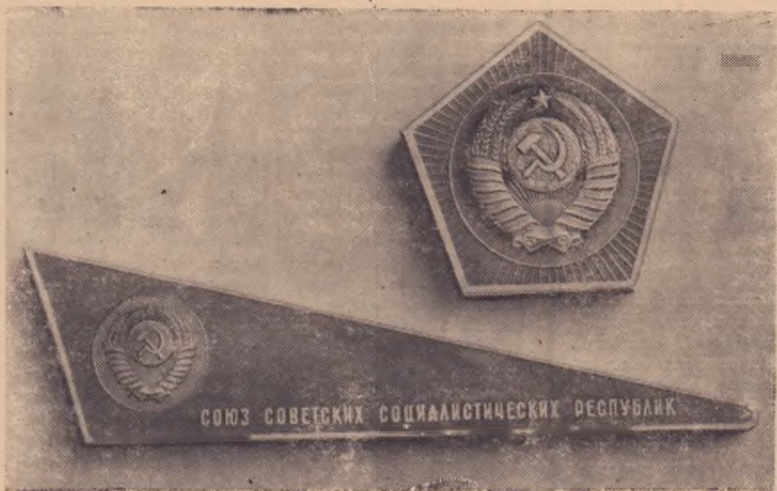
Вымпел и Государственный герб Советского Союза (лицевая сторона), доставленные на Луну советской космической станцией «Луна-9».