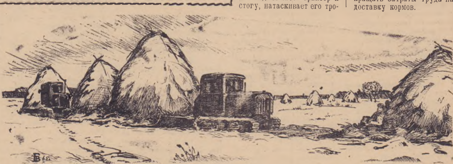
С лугов — на фермы. Рисунок нашего внештатного художника В. Губкина.

Так транспортируются корма не только в Позднякове, а во многих хозяйствах района. И правильно. Надо беречь корма, не допускать их потерь и сокращать затраты труда на доставку кормов.