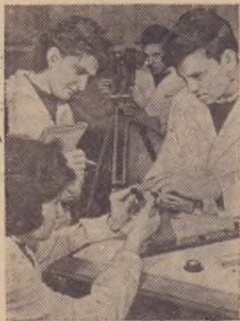
София. Учащиеся техникума оптической механики на занятиях. Сейчас в Болгарии учится каждый пятый человек. Образование стало подлинным достоянием народа.