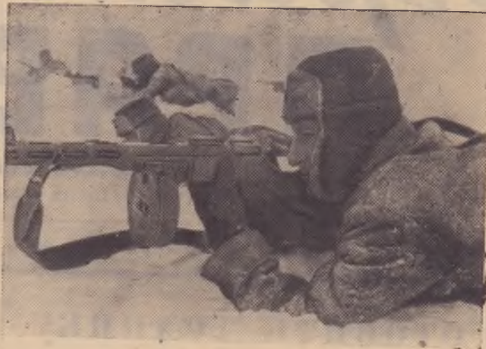
На снимке: бойцы пехотных частей ведут наступательные бои зимой 1941 года, отгоняя немцев на запад.

К 25-й годовщине разгрома немецко-фашистских войск под Москвой