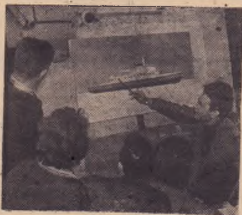
ГОРЬКИЙ. Конструкторы судостроители разработали проект нового паром-ледокола «Кронштадт», который обе-

Повышая уровень организаторской, массово-политической работы среди трудящихся, наши партийные организации должны сосредоточить все основное внимание на успешном завершении первого года пятилетки, достойной встрече юбилейного года.