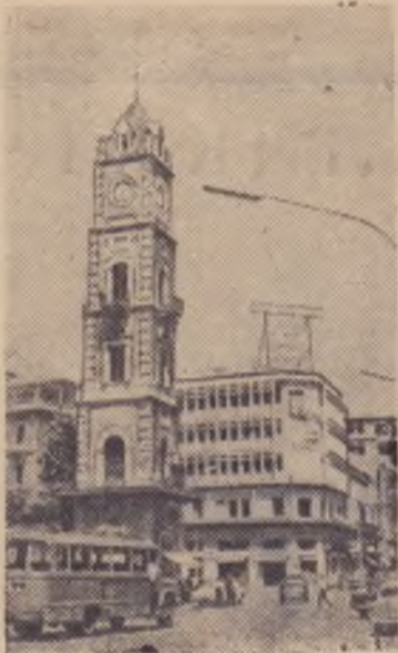
Триполи—второй по населению и политико-экономическому значению город Ливана.