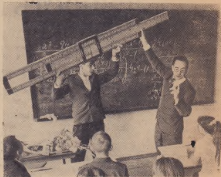
ГОРЬКИЙ. 1320 учащихся начали занятия в новой средней школе № 40 с математическим уклоном. Школа размещена в двух смежных зданиях. В одном из них вместо привычных классов — предметные кабинеты математики, физики, химии, краеведения и другие. Здесь же находятся лаборантская, АТС, радиопункт, библиотека. Во втором здании — огромный спортивный зал, столовая.

Н. ЧЕРНОВ, главный зоотехник управления.