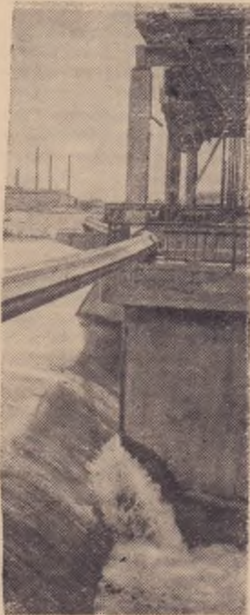
КРАСНОЯРСКИЙ КРАЙ. На Назаровской ГРЭС идет строительство и монтаж блока, где будет установлен уникальный генератор мощностью 500 тысяч киловатт.