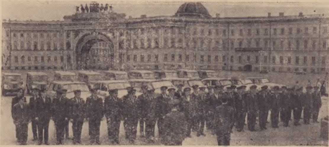
Советские люди одобряют Указ Президиума Верховного Совета СССР «Об усилении ответственности за хулиганство». Милиция Ленинграда совместно с общественностью города принимает энергичные меры к усилению борьбы с хулиганами, пьяницами, тунеядца-