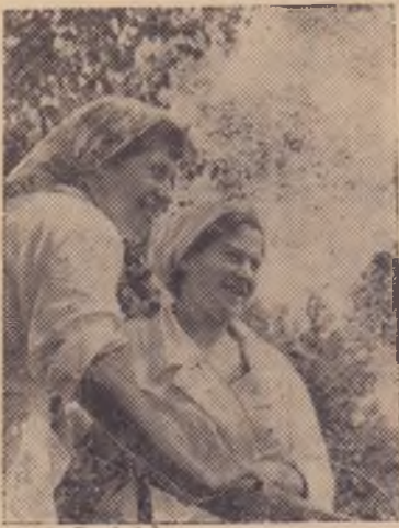
Свердловская область. Совхоз «Исток» является экспериментальной базой Уральского научно-исследовательского института сель-

ского хозяйства. Здесь разводят высокоудойных коров черно-пестрой породы.