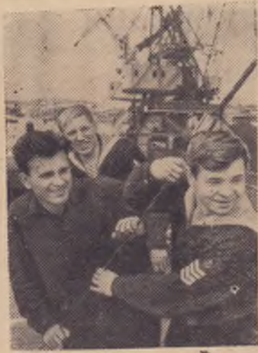
Кандалакша. Более чем в пять раз по сравнению с 1963 годом возросло количество отгружаемого железнодорожного концентрата в Кандалакшском морском торговом порту. Такой рост стал возможен благодаря вводу в строй Волго-Балтий-

ского канала. Прямая водная линия Кандалакша—Череповец действует бесперебойно. Один за другим швартуются у причалов порта рудовозы типа «Волго-Балт», погрузка занимает считанные часы. И вот уже суда держат курс к металлургическому гиганту в Череповце.