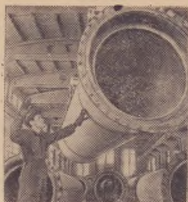
Ленинград. На заводе «Баррикада» — одном из инициаторов почина за экономию материалов —

разработаны мероприятия по широкому применению предварительно напряженной арматуры на многих видах изделий, по расширению производства напорных железобетонных труб, использование которых в строительстве вместо чугунных экономит народному хозяйству 800 тонн металла на 1 погонный километр.