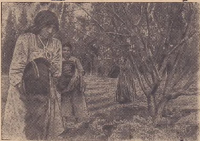
ОАР. Арабские крестьянки — жительницы новой деревни «Наср» («Победа») в провинции ат-Тахрив вносят удобрение на апельсиновой плантации.