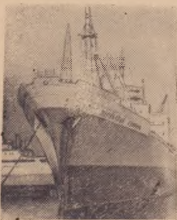
Замечательный подарок стране сделали судостроители Херсона. Они спустили на воду океанское сухогрузное судно с газотурбинной установкой. Новому судну дано название «Парижская коммуна».

На снимке: новый газотурбоход у пирса судостроительного завода.