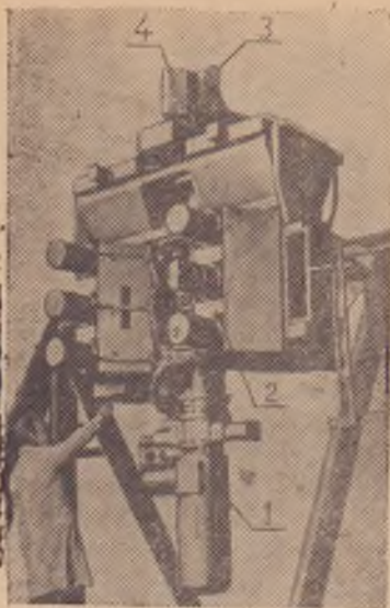
Комплекс научной аппаратуры станции «Протон».