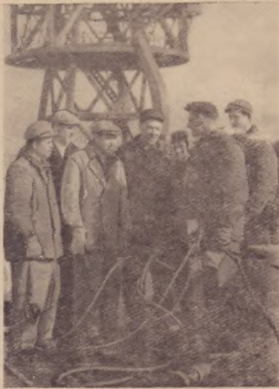
съездовская трудовая вахта, на которую встали в эти дни обе бригады, покажет, кто будет впереди.