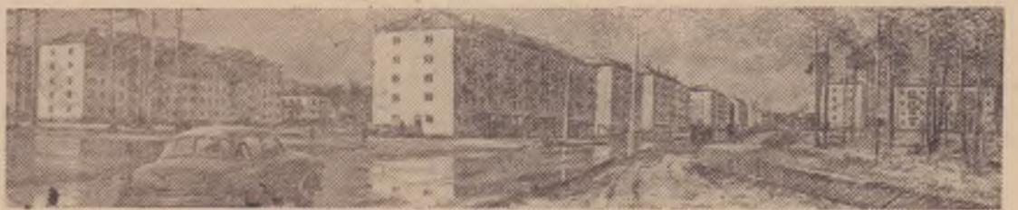
Электрическая столица Сибири — город Братск в конце года отмечает свое десятилетие. Десять лет назад у Падунских порогов появились первые строители. Нынче уже не каменные утесы, а вставшая на века 126-метровая железобетонная плотина гидроэлектростанции господствует в Падунском сужении.

На снимке: Сибирская улица в Братске.