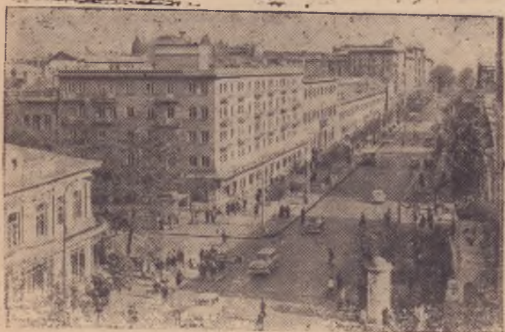
Город-герой Одесса. На снимке: Дерibasовская улица.