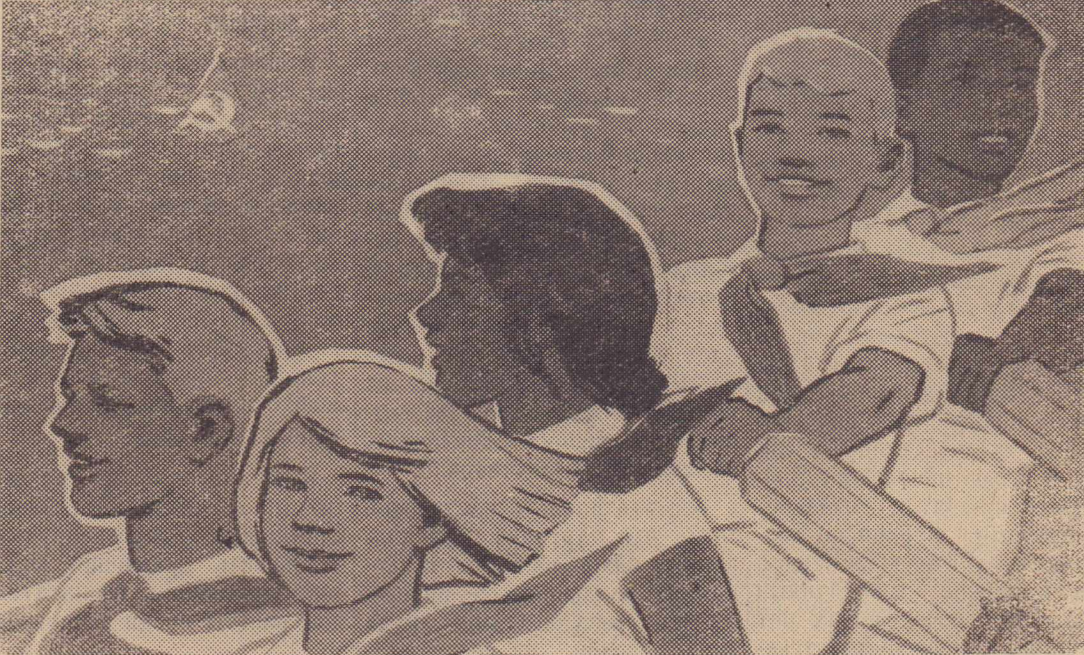
Плакат худ. Н. Вигилианской (издательство «Советский художник»).