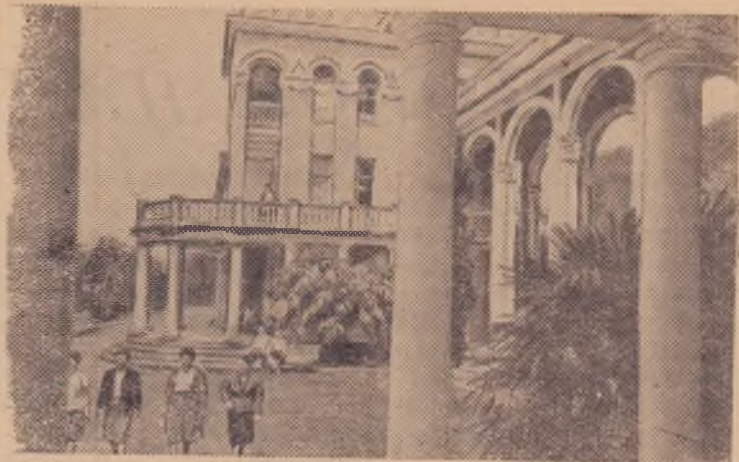
Грузинская ССР. Курорт Мендзи. Санаторий «Колхида».

тивов, учесть недостатки, наметить пути устранения их. Расставить коммунистов на решающие участки. Вся политическая, организационная работа должна способствовать повышению активности тружеников города и села в хозяйственной и общественной работе. Ознаменуем районную конференцию новыми успехами в труде!