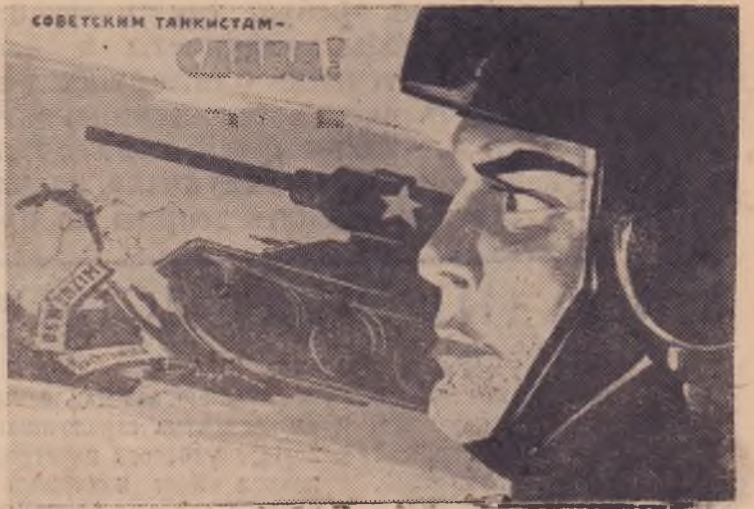
Плакат художника Б. Решетникова. (Издательство «Советский художник»).