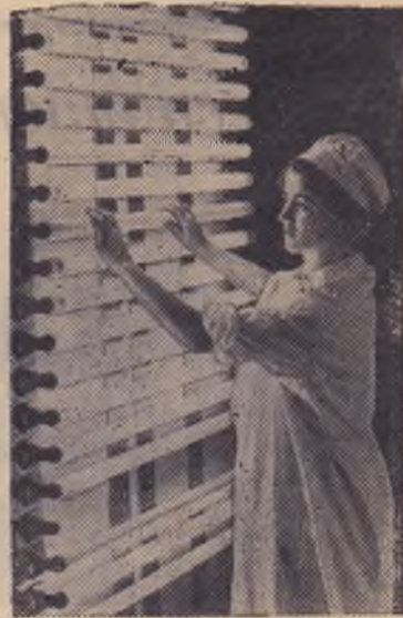
Азербайджанская ССР. Выпускать продукцию только отличного качества — к этому стремится коллектив бакинского завода «Азерэлектросвет».

На предприятии работают опытные специалисты. Организованы курсы по повышению квалификации рабочих. Резко уменьшилось количество брака, себестоимость люминесцентных ламп значительно снизилась.