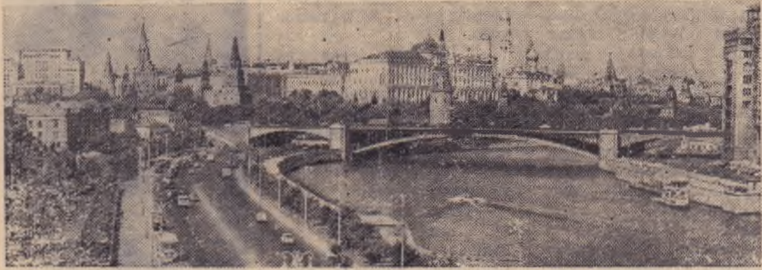
Москва сегодня. Вид на Кремль с Кропоткинской набережной.

Такие шкафы понравятся каждому. Они не только удобны и красивы, но и оригинальны по конструкции — их выпускают в отделанных щитов, брусков, ящиков, полок, стекол. А сборкой занимается сам покупатель. Выбрав в магазине по рисункам на рекламных проспектах нужный образец, он привозит домой компактные пакеты с деталями. Сделать из них шкаф не составляет особого труда. Универсально-разборная мебель очень перспективна. Ее особенности позволяют