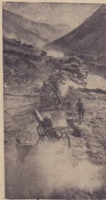
ТАДЖИКСКАЯ ССР. На строительстве Нурекской ГЭС. Самоходные бурильные установки на правом берегу Вахша. В нынешнем завершающем году семилетки начнется открытие реки.