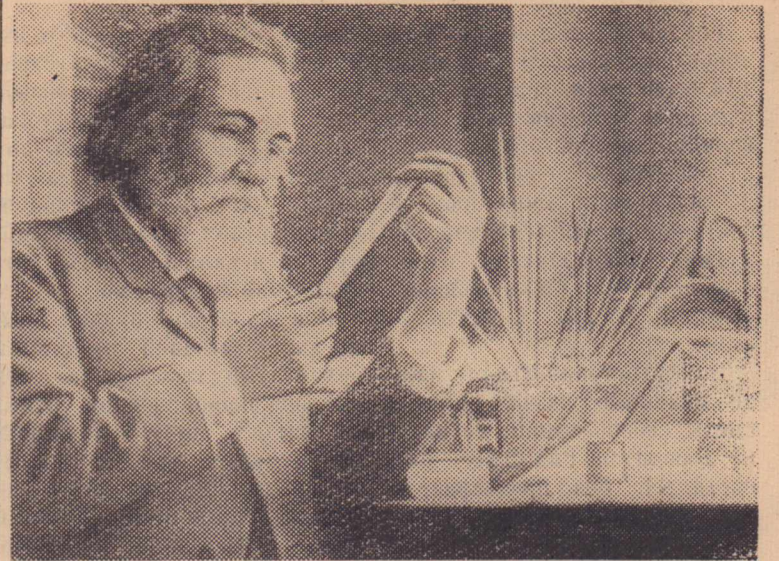
Мечников Илья Ильич (1845—1916), великий русский биолог, один из основателей современной экспериментальной биологии. 15 мая 1965 года исполняется 120 лет со дня его рождения.