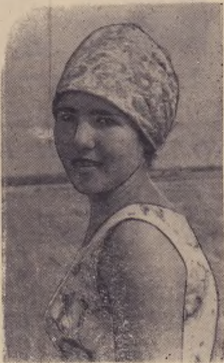
Фото Л. Леонидова.