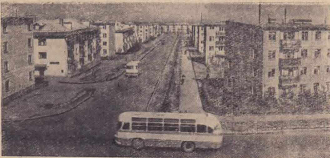
Казахская ССР. Улица имени Мориса Тореза в Алма-Ате.