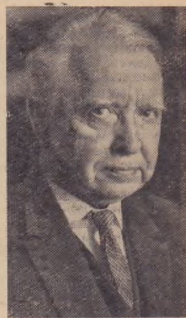
Виноградов Александр Павлович — выдающийся советский ученый-геохимик и биогеохимик. 21 августа ему исполнилось 70 лет со дня рождения.