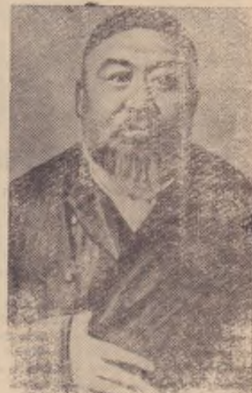
Абай Кунанбаев—основоположник казахской литературы, поэт-писатель и общественный деятель. Ему исполнилось 120 лет.

Освещенный двумя лампочками, от пыли ставшими матовыми, ток напоминал небольшой корабль в огромном черном океане темноты. Очевидно, на корабле был объявлен аврал. Гремели сортировки, равномерно постукивал движок, хлопала лента транспортера, урчали автомашины. Люди руководили всей этой