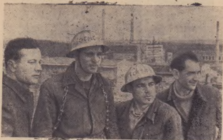
946 тонн мяса, 23,5 миллиона штук яиц должна сдать в этом году государству Голицинская птицефабрика Московской области. Производство здесь хорошо механизировано. В убойном цехе действует конвейерная линия. Процесс начинается с электроглушения птицы, очистки от пера и заканчивается обработкой, сортировкой, упаковкой и отправкой в холодильник. Обслуживают линию девятнадцать человек, обрабатывая за смену 5.500 голов птицы.