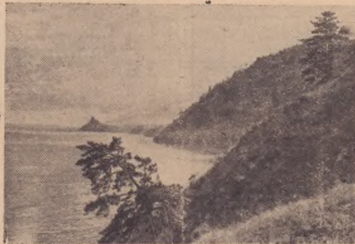
Байкал в районе бухты Песчаной.