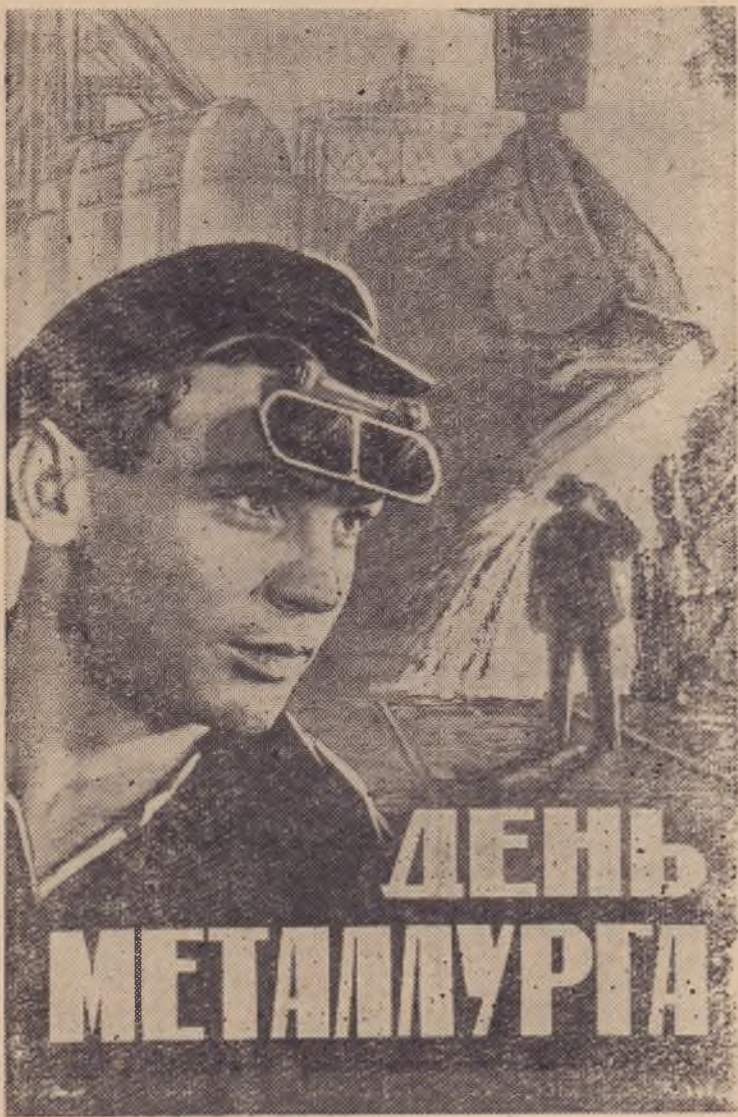
Фотомонтаж С. Новомлинского. Фотохроника ТАСС

Дальнейшее быстрое увеличение производства металла и топлива, составляющих фундамент современной промышленности, по-прежнему останется одной из важнейших народнохозяйственных задач.