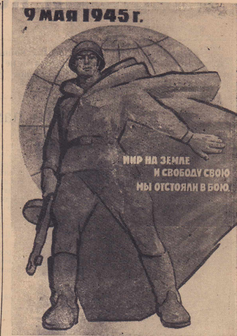
Плакат художника В. Боликова (издательство «Советский художник»).

В честь 20-летия победы советского народа над фашистской Германией в наших сельских клубах района с 3 по 15 мая проводится кинофестиваль о подвигах при защите Родины, о фронтовых буднях, о патриотическом долге, о дружбе и любви, о счастье, о мире.