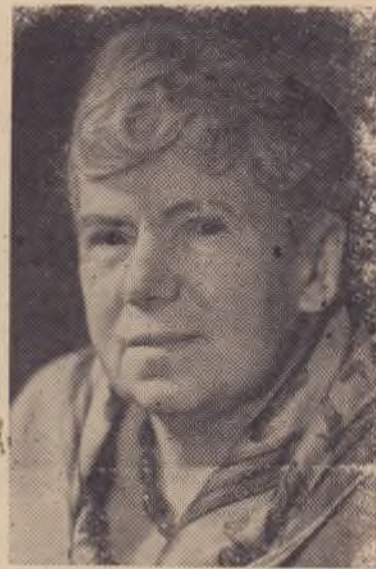
Инбер Вера Михайловна, советская писательница. 10 июля исполняется 75 лет со дня рождения (1890). Фотохроника ТАСС.