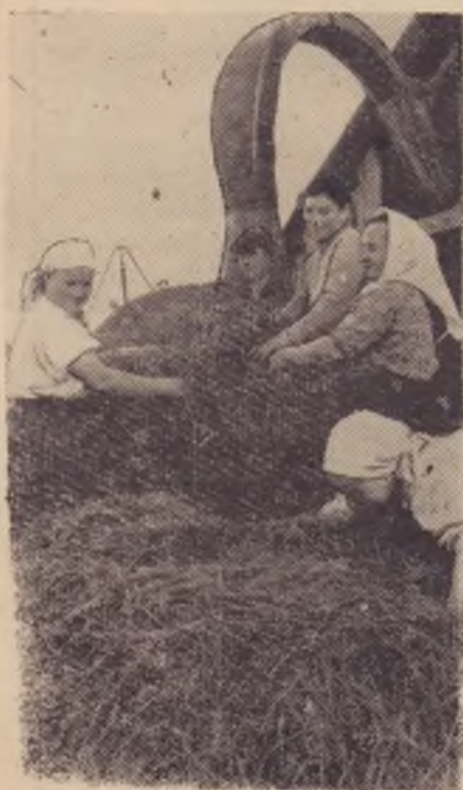
В Валтовском отделении совхоза «Кулебакский» продолжается за-

Меры, намеченные мартовским Пленумом ЦК КПСС по увеличению производства животноводческих продуктов, сыграют положительную роль только в том случае, если все колхозы и совхозы по-настоящему организуют борьбу за создание прочной кормовой базы. Важным резервом увеличения производства кормов является улучшение лугов и пастбищ.