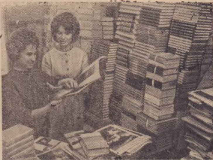
Москва. 30 июня исполняется 45 лет со дня основания в нашей стране по инициативе В. И. Ленина Всесоюзной книжной палаты.

Книги в нашей стране издаются на 61 языке народов Советского Союза и на 35 языках народов зарубежных стран. За годы Советской власти в СССР выпущено 1.903.961 издание книг общим тиражом 28 миллиардов 751 миллион экземпляров. Для полного библиографического и статистического учета печати в Советском Союзе создана сеть специальных учреждений. Главное место среди них занимает Всесоюзная книжная палата, куда поступают обязательные экземпляры всех выходящих в стране изданий.