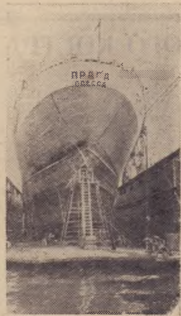
Вступивший недавно в строй на судоремонтном заводе Новороссийского морского порта док-гигант позволил значительно сократить сроки ремонта судов.

На снимке: ремонт крупнотоннажного судна «Прага».