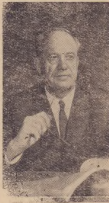
Петрусь Бровка (Петр Устинович Бровка). Выдающийся белорусский советский поэт.

Наш календарь (к 60-летию со дня рождения)