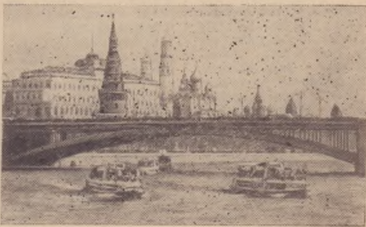
Москва сегодня. Вид на Кремль со стороны Большого Каменного моста.