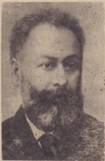
21 июня исполняется 125 лет со дня рождения Ахилия Церетели (1840-1915), выдающегося грузинского поэта.