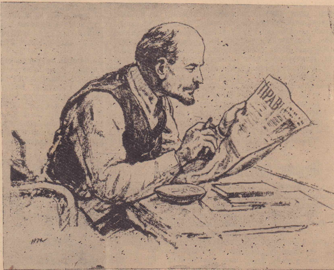
Рисунок народного художника СССР Н. Жукова.