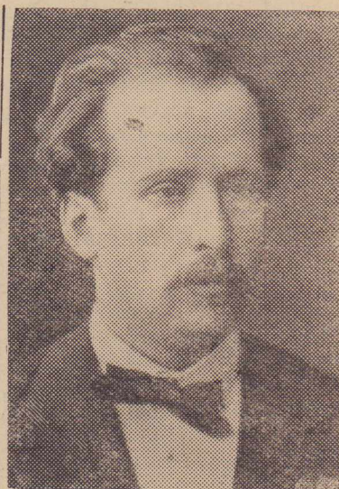
Николай Григорьевич Рубинштейн (1835—1881), крупнейший русский музыкальный деятель, педагог, выдающийся русский пианист и дирижер, один из основателей Московской консерватории.