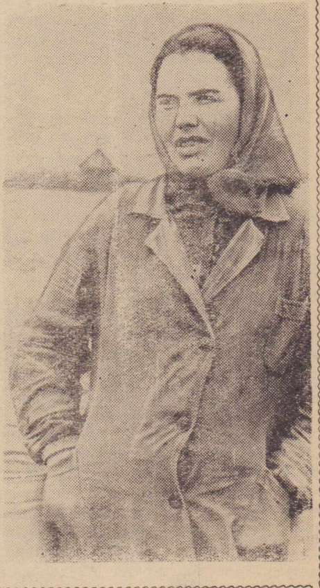
Фото Л. Леонидова.