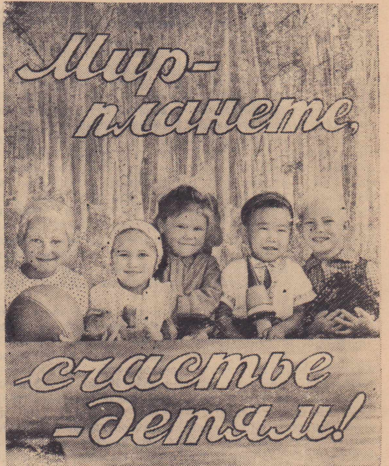
Фотоплакат О. Кузьмина к Международному дню защиты детей.